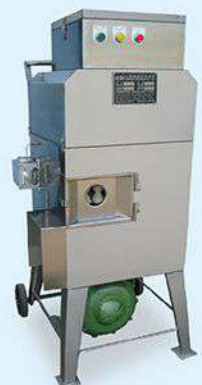
MZ-268A Corn Cutter 玉米脫粒機