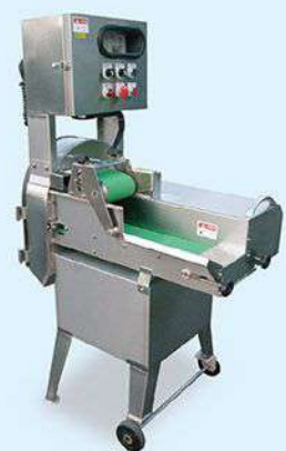
GW-805A Vegetable Cutter 切菜機