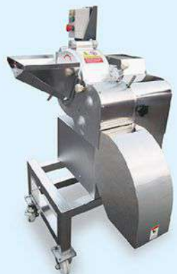
CD-800 Dicing Machine 切丁機