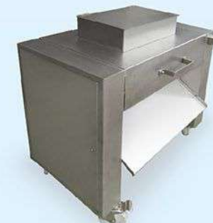
GW-150L Chicken Meat Cutter 雞肉切割機