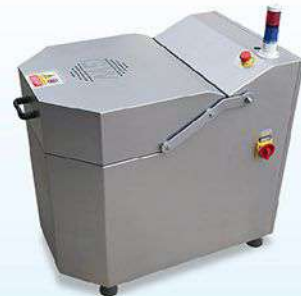
HY-06 Small Vegetable Centrifuge 葉菜脫水機