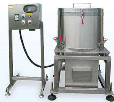
HY-15 Vegetable Centrifuge 蔬菜脫水機