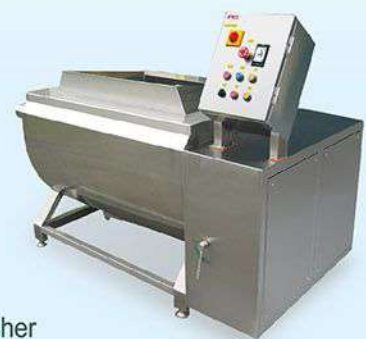
WA-106CE Multiple Vegetable Washer 萬能蔬菜洗淨機